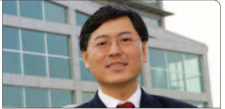
شرکت Lenovo که یک شرکت چند ملیتی است، در سال ۱۹۸۴ در کشور چین بنیان گذاشته شد

به طور حتم بله. ما در حال حاضر گام به گام به مرحله‌ای نزدیک می‌شویم که تمامی محصولاتمان را به بازار جهانی عرضه کنیم تا تنها به یک مکان خاص محدود نشویم. من فکر می‌کنم که مدت زمان زیادی نمانده است که ما به جایی برسیم که به جایگاه برترین تولیدکننده در جهان دست پیدا کنیم و برای رسیدن به این هدف برنامه‌ریزی‌های بلند مدتی خواهیم داشت و از اوایل سال آینده شما می‌توانید نتایج این برنامه‌ریزی‌ها را در روند کاری ما مشاهده کنید.